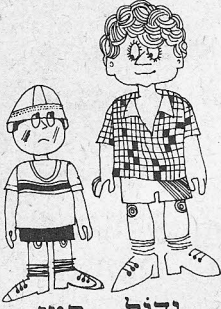
גָּדוֹל - קָטָן